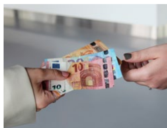
2 Gebruikelijk loon en vrijwilligersvergoeding