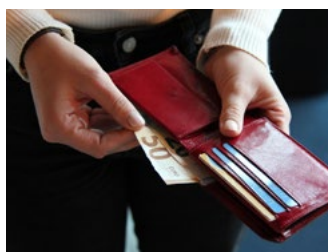
5 Subsidies en tegemoetkomingen