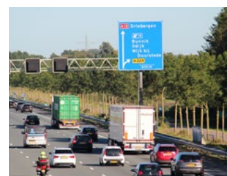
4 Tips voor werkgevers