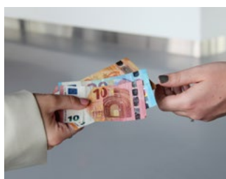
3 Tips voor de bv en de dga