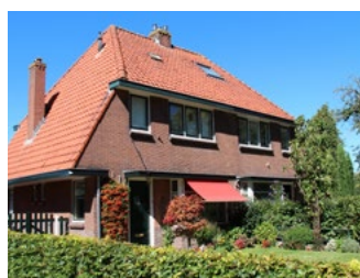
6 Tips voor de woningeigenaar