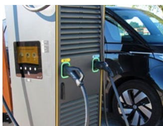
5 Tips voor de automobilist