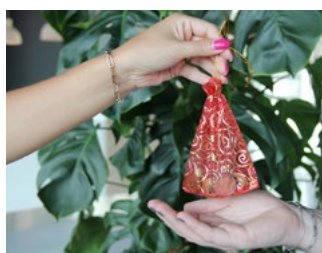
7 Tips inzake de btw