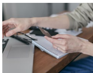
7 Tips inzake de btw