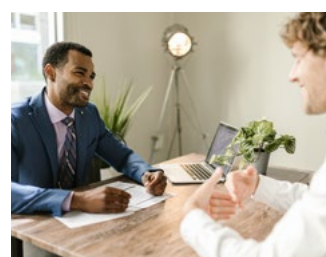
4 Tips voor werkgevers