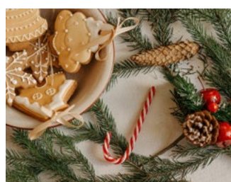
3 Tips voor de bv en de dga