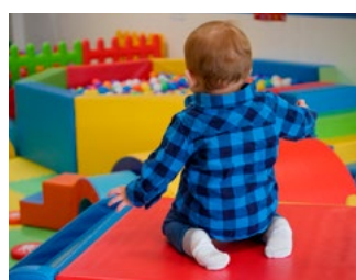
7 Overige, eerder aangekondigde en te verwachten voorstellen

Deze special bevat voorstellen van het kabinet die de komende periode in het parlement worden behandeld. De voorgestelde maatregelen treden per 1 januari 2022 in werking, tenzij anders is vermeld.